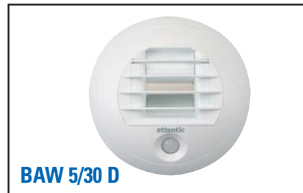
BAW 5/30 D