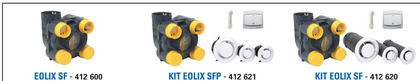
EOLIX SF - 412 600