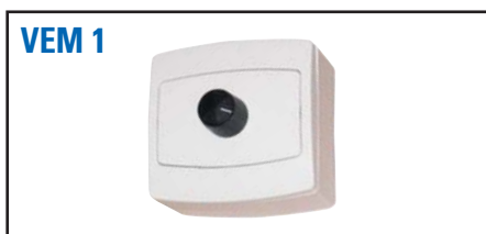
VARIATEURS ELECTRONIQUES DE VITESSE : de 20 à 100 %