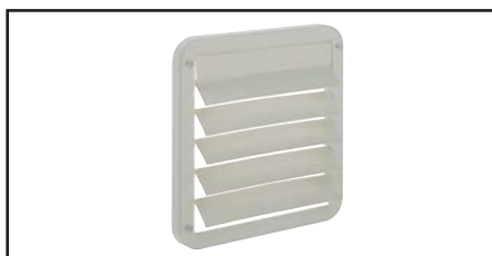
VOLETS EXTERIEURS à lamelles.