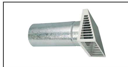
CAPOT EXTERIEUR avec manchon télescopique.