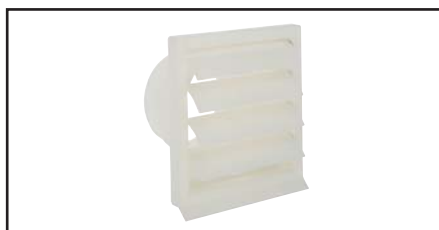
VOLET AUTOMATIQUE EXTERIEUR permettant de raccorder des conduits Ø 100/120/125.