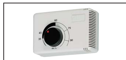
HYGROSTAT pour cuisine, salle-de-bains et pièces humides. Réglable de 45 à 90% d'humidité relative. IP40, 230 V, maxi 150 w.